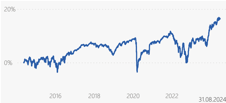
Abb.: die Berechnung dieser Performancedaten erfolgt auf Basis des Preises eines Anteils am Anfang der Periode. Ausschüttungen werden berücksichtigt. Kosten der Verwaltungsgesellschaft und der Verwahrstelle sind ebenfalls berücksichtigt. Ein Ausgabeaufschlag für diese Anteilsklasse fällt nicht an. Zusätzlich mindern das Anlageergebnis individuell anfallende jährliche Depotkosten. Die bisherige Wertentwicklung ist kein Indikator für die zukünftige Wertentwicklung, diese ist nicht prognostizierbar.